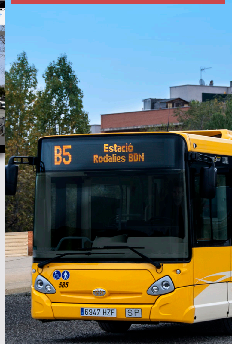
Recorregut de la línia B5: zones amb canvis de recorregut